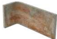
Angolo interno / AZ 6 10x20x10 cm 4x8x4 in Inside corner Innen-Ecke Angle intérieur 030