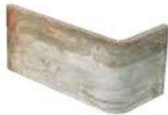
Angolo esterno / AZ 6 10x20x10 cm 4x8x4 in Out corner Aussenecke Angle extérieur 030