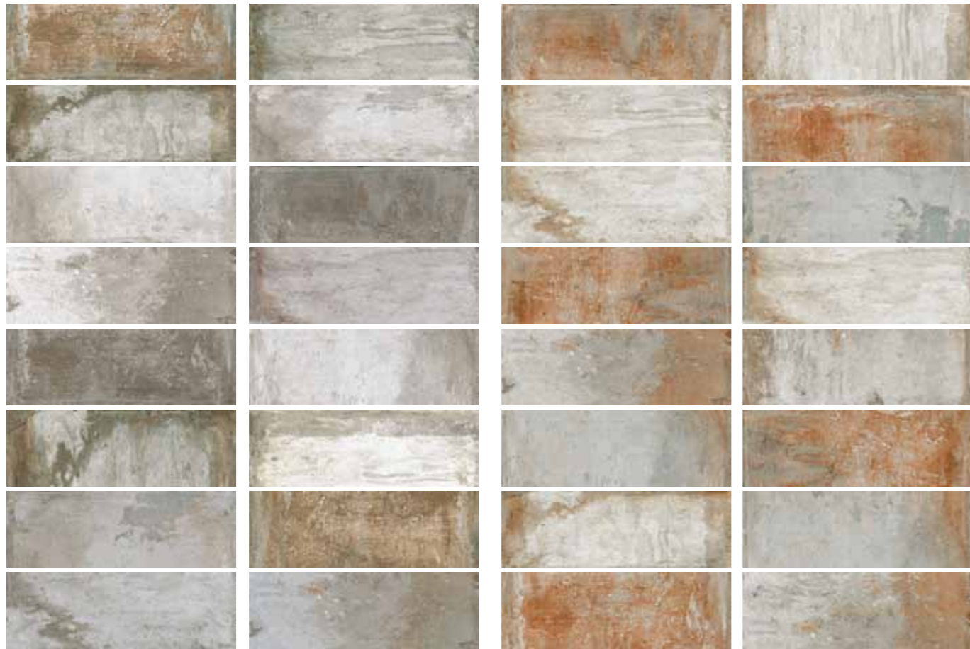
AZ 5 / Grigio 10x30 cm 4x12 in 092